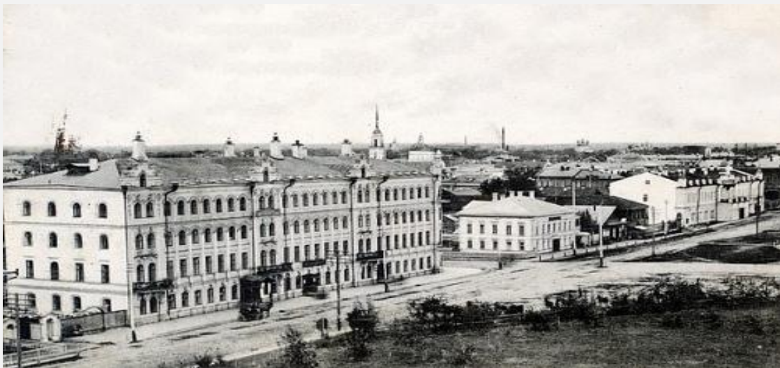
Управление статистики уполномоченного Госплана по Вологодской области в годы войны располагалось в здании гостиницы «Золотой якорь»

Великая Отечественная война потребовала существенного изменения программы статистических работ, методов сбора и обработки статистической информации, максимального повышения оперативности. Постоянно возникала потребность в немедленных сведениях, что вызвало необходимость в организации декадной и суточной отчетности.