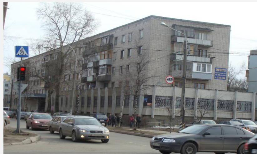
Здание, где в настоящее время размещается Территориальный орган федеральной службы государственной статистики по Вологодской области