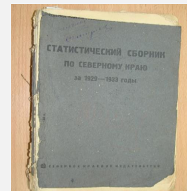
Статистический сборник Северного краевого управления народно-хозяйственного учета, 1934 год