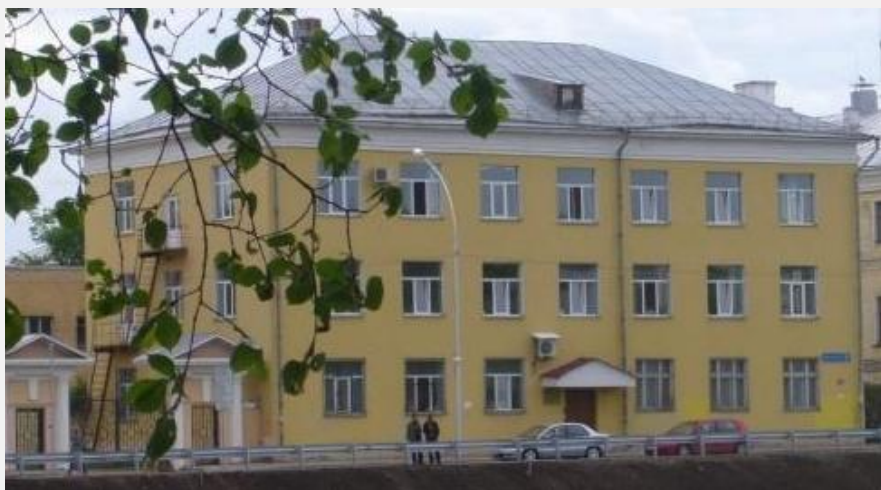
Здание Вологдастата на Пречистенской набережной

Принятие Федерального закона от 29 ноября 2007 года № 282-ФЗ «Об официальном статистическом учете в системе государственной статистики» обусловило создание правовых основ для реализации единой государственной политики в сфере официального статистического учета.