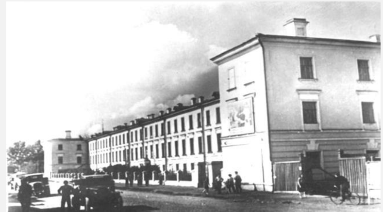
Вологодский губернский статистический комитет со дня основания и до 1921 г. располагался в центре Вологды на живописной набережной. Сейчас это здание Вологодского государственного университета

Наиболее плодотворно Вологодская земская статистика работала до 1912 года. К этому времени был накоплен опыт проведения различных единовременных статистических работ, выборочных обследований, разработаны методика опроса, карточные формуляры наблюдения, широко применялись группировки, особенно комбинационные.